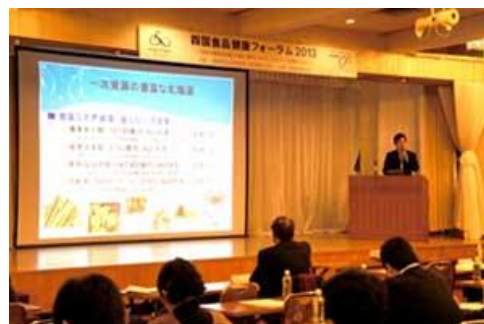
【企業の事業化計画等をブラッシュアップ】 【フォーラムを開催し食産業振興を支援】