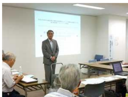
【他地域支援機関との連携マッチング】 【マッチングに向けて四国企業が自社PR】